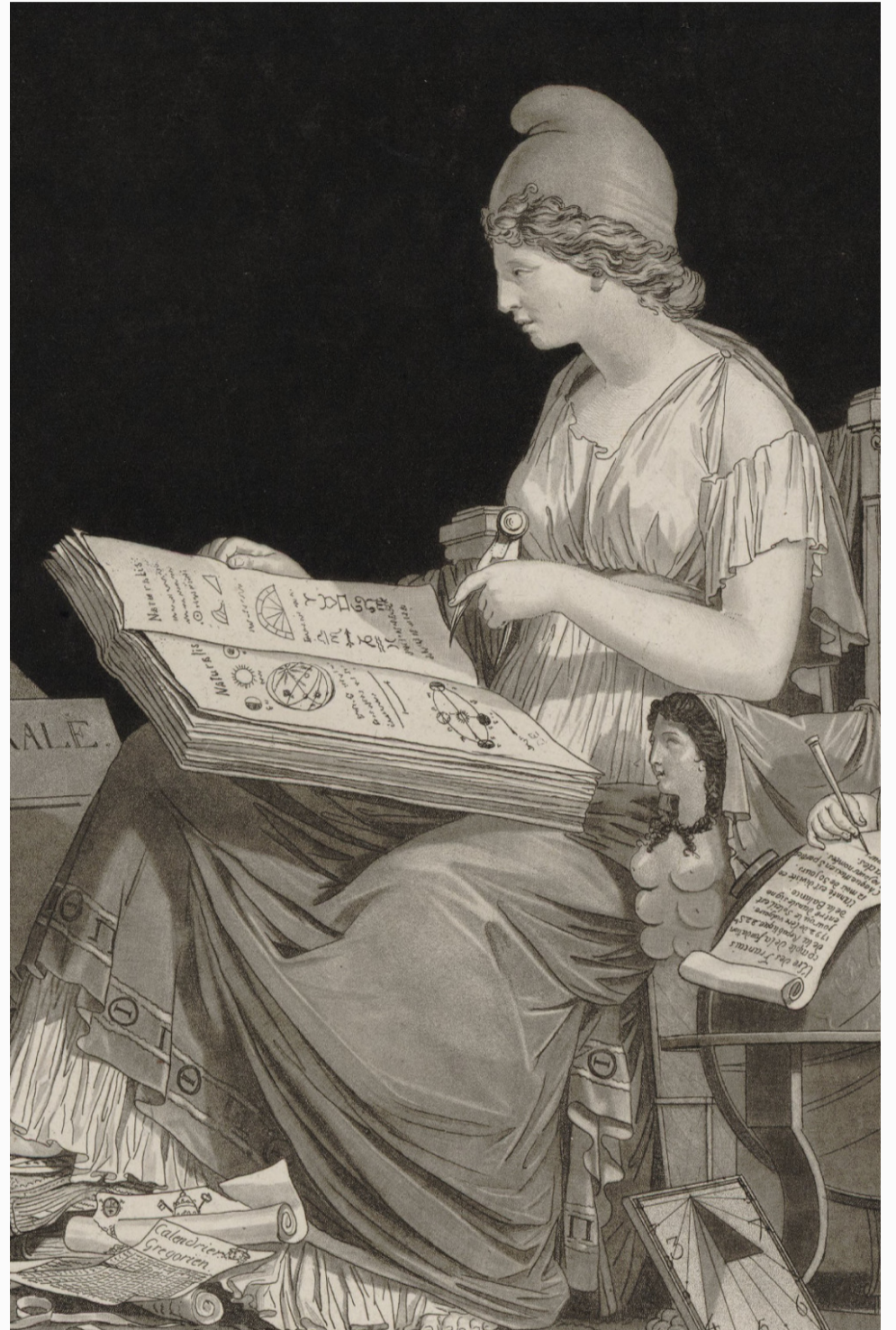
Sarmacja — konglomerat sztuk.

Trzeba dodać w tym miejscu, że mikronacyjna mimesis nie jest koniecznym poszukiwaniem ekwiwalentów realnych cech państwa i społeczeństwa. Mamy bowiem do czynienia również z groteską, hiperbolą lub absurdem, które wchodzą niekiedy w miejsce możliwych, „poważnych” zamienników i stanowią ironiczny komentarz do realnych zdarzeń, instytucji, osób lub sytuacji.