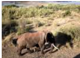
Lwy, słonie i sardynki