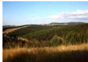
Droga do Mbabane, stolicy Suazi