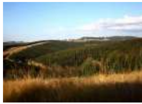
Droga do Mbabane, stolicy Suazi