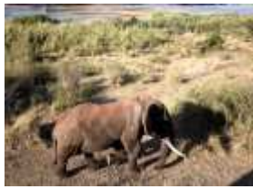
Lwy, słonie i sardynki