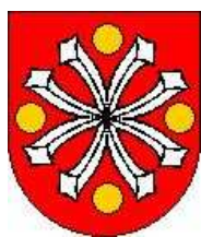
Wzór herbu Miasta