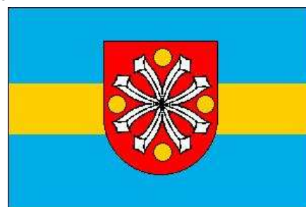
Wzór chorągwi miejskiej